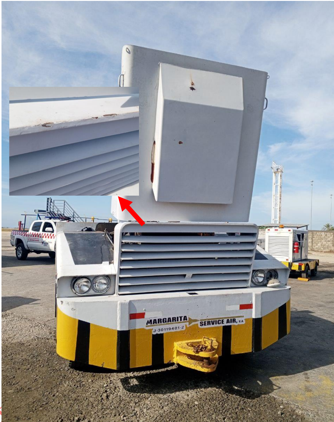
Figura 4. Paymover involucrado en el suceso. Año: 2025