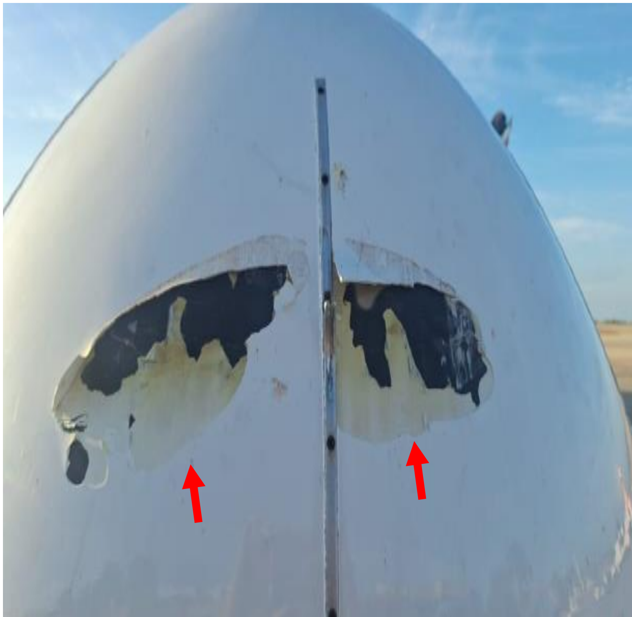
Figura 3. Daños en el Radomo Aeronave YV3145. Año: 2025