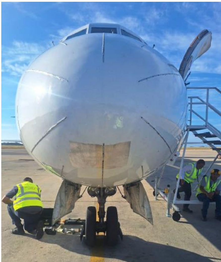
Figura 9. Radomo reparado YV3145. Fuente: Investigador Encargado Año: 2025

Se realizó entrega de la CESIÓN DE CUSTODIA TOTAL bajo el N° 045/2025 .