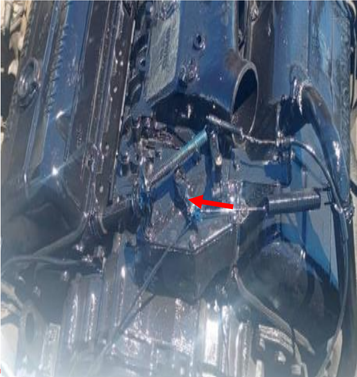
Figura 8. Guaya de ahogo del motor del PAYMOVER. Fuente: Investigador Encargado Año: 2025