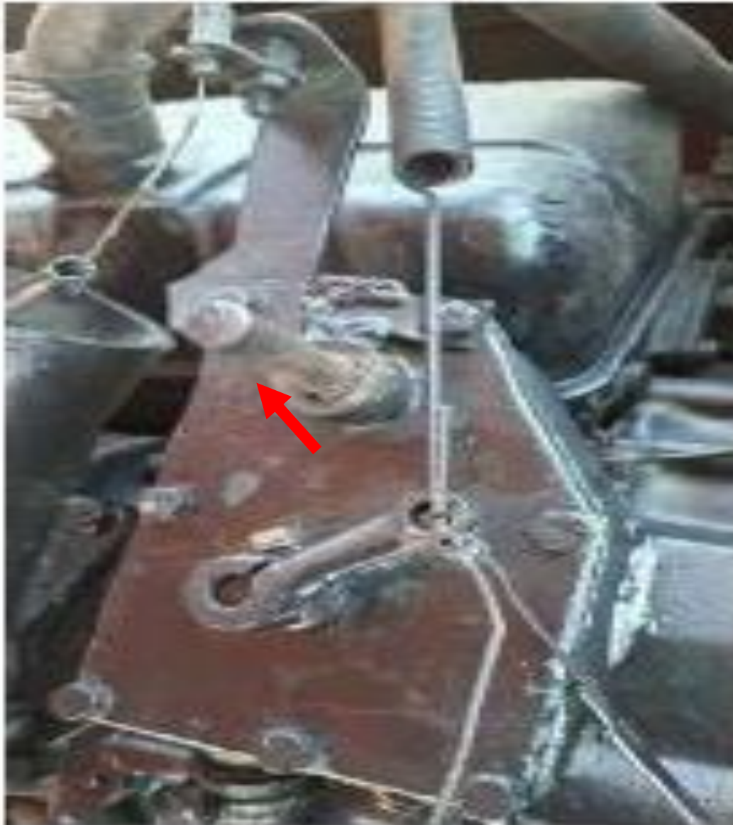
Figura 6. Sistema de varillaje de aceleración del PAYMOVER dañado. Fuente: Investigador Encargado Año: 2025