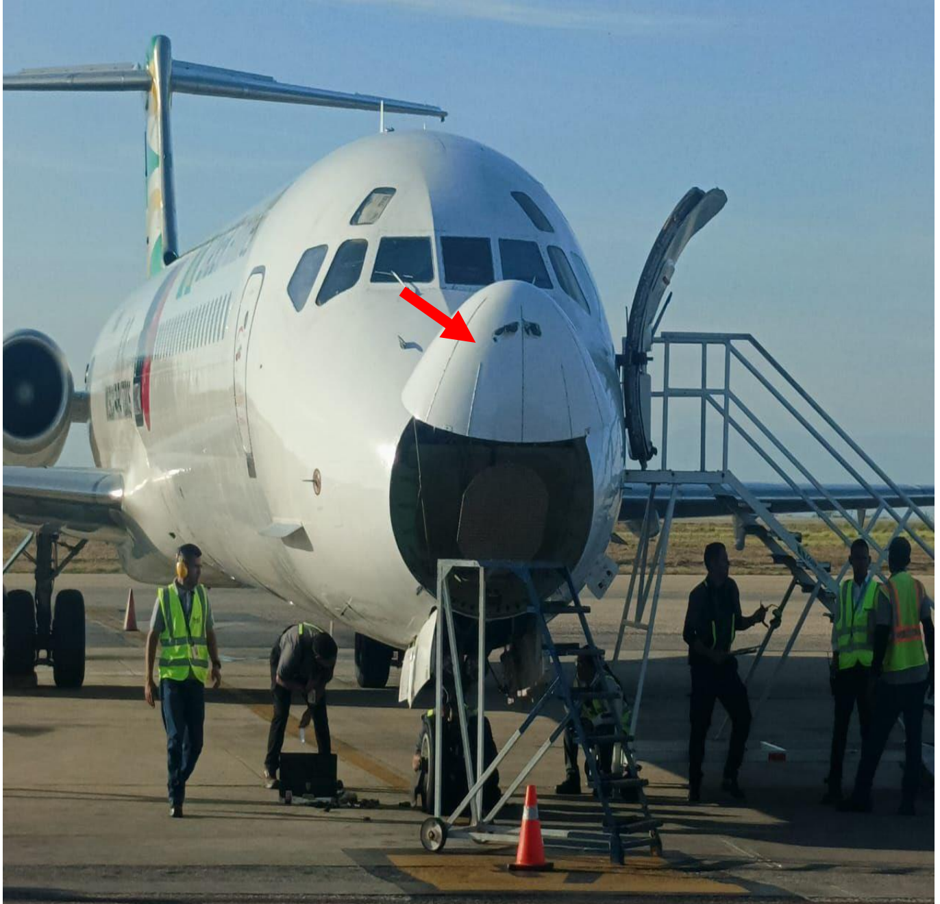
Figura 2. Daños en el Radomo Aeronave YV3145. Fuente: Investigador Encargado Año: 2025