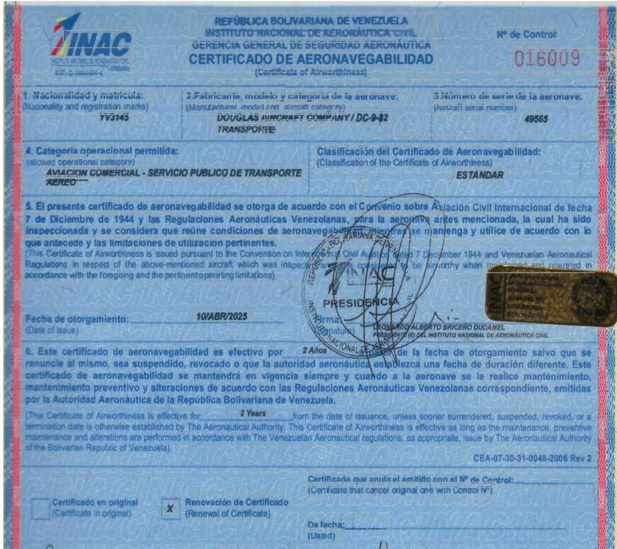
Figura 1. Certificado de Aeronavegabilidad YV3145

Fuente: Investigador Encargado. Año: 2025