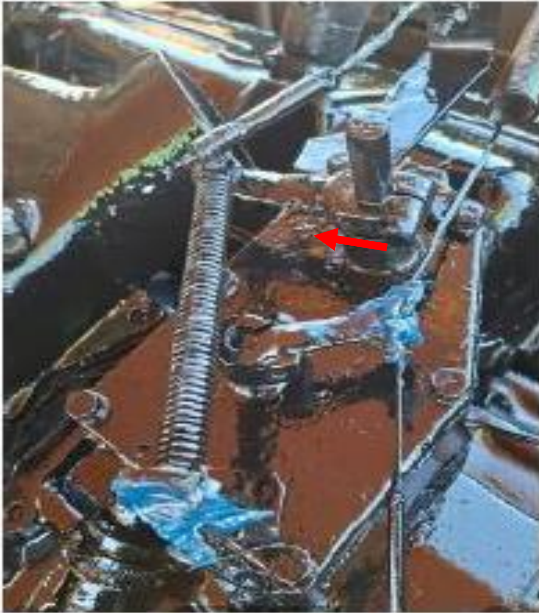
Figura 7. Sistema de varillaje de aceleración del PAYMOVER reemplazado. Año: 2025