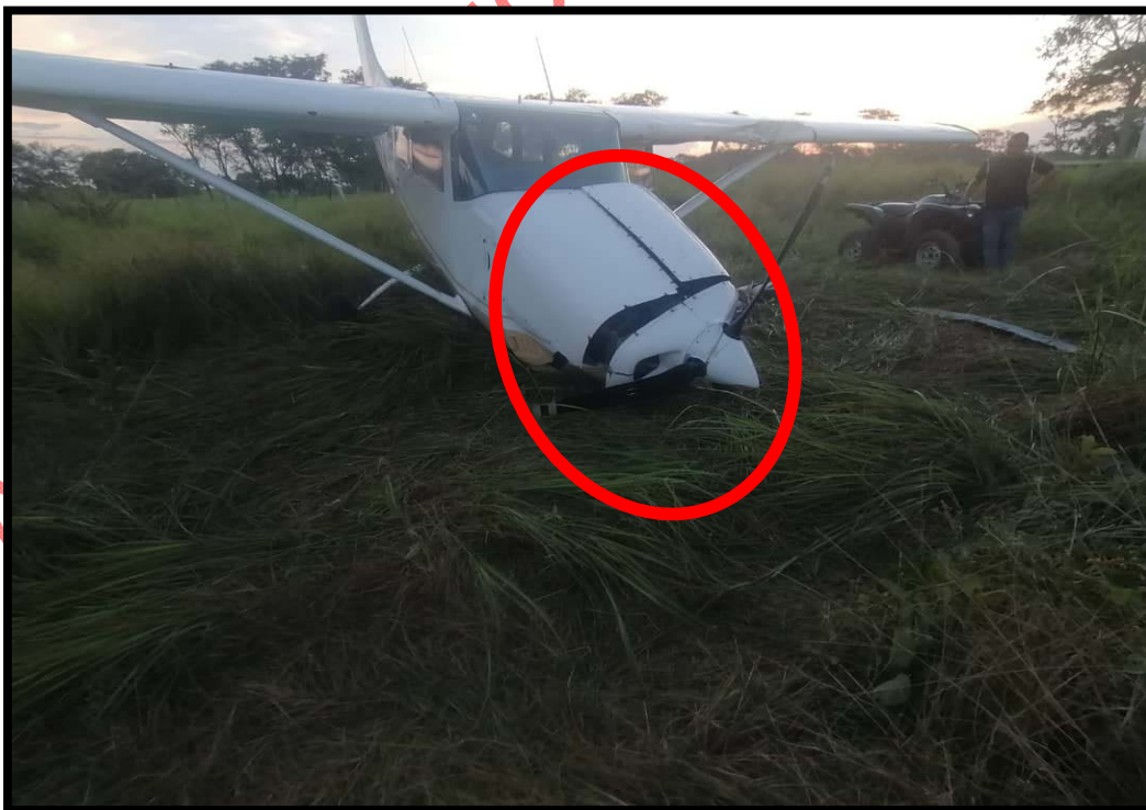
Imagen 3: Evidencia de daños sustanciales en la zona del motor de la aeronave

Fuente: Investigador Encargado Año: 2023