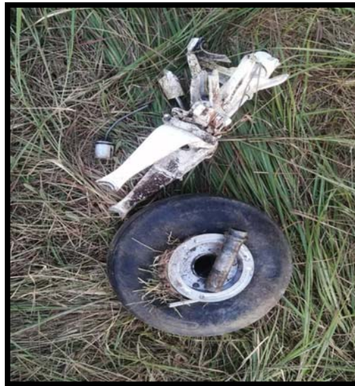
Imagen 4: Tren de aterrizaje fracturado Año: 2023