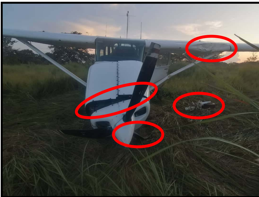
Imagen 2: Vista frontal con la identificación de los daños de la aeronave

Fuente: Investigador Encargado Año: 2023