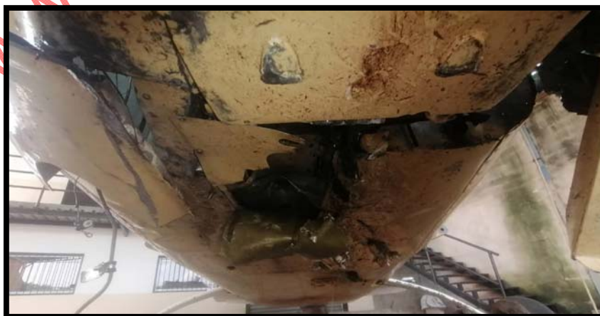
Imagen 5: Lámina inferior fracturada Año: 2023