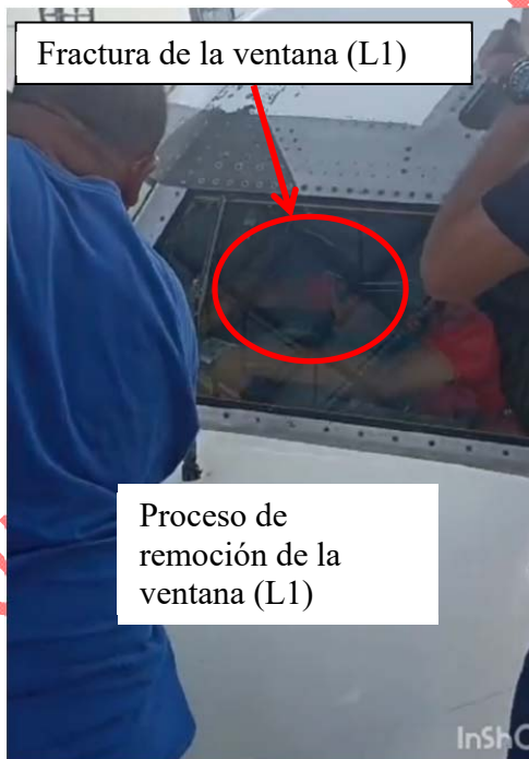
Fractura de la ventana (L1)