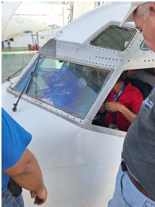
Proceso de instalación de la ventana (L1)

Por los motivos antes expuestos, mediante el presente informe se da cierre a la investigación.