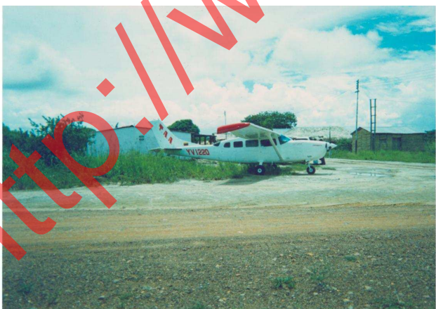
Fig. 1 La aeronave YV1220 después del aterrizaje de emergencia.

La aeronave aterrizó en una carretera asfaltada (Vía Perimetral de la Paragua), a 10 NM Radial 030° del aeródromo La Paragua, la aeronave no resultó con ningún tipo de daño.