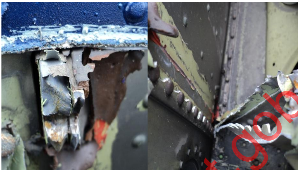
Fotografía 5 El Momento flector generado por el impacto desgarró el larguero que une el pión con fuselaje del motor 1

Daños en los cobertores del cableado del motor 1, por la tensión que se generó durante el desprendimiento de dicho motor.