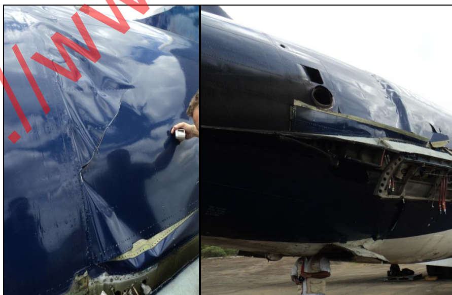
Fotografía 7 Deformación plástica del fuselaje y desprendimiento en el revestimiento de la aeronave

Hubo una deformación plástica por compresión en la sección posterior del fuselaje como consecuencia del impacto en la fase de aterrizaje, generando así un desprendimiento en el revestimiento de la aeronave.