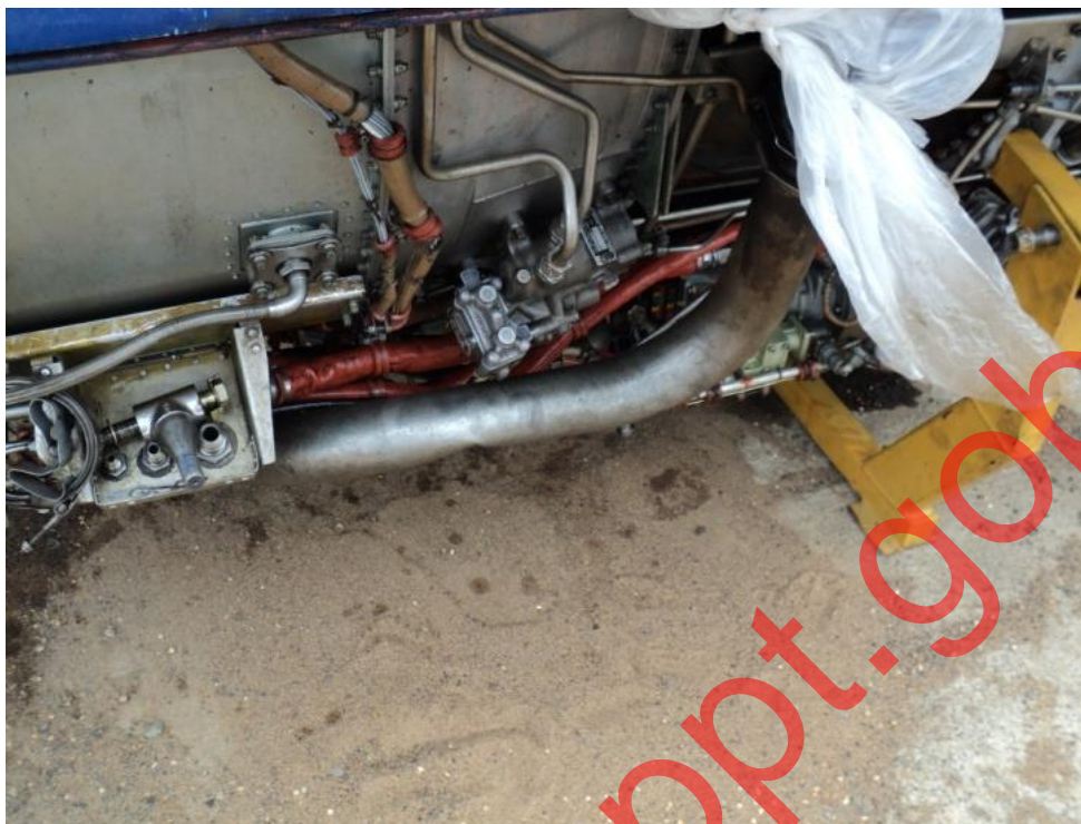
Fotografía 6 Deformación en el conducto del motor de arranque del motor S/N: 707162