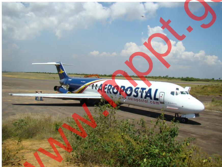
Fotografía 1 Imagen general del accidente