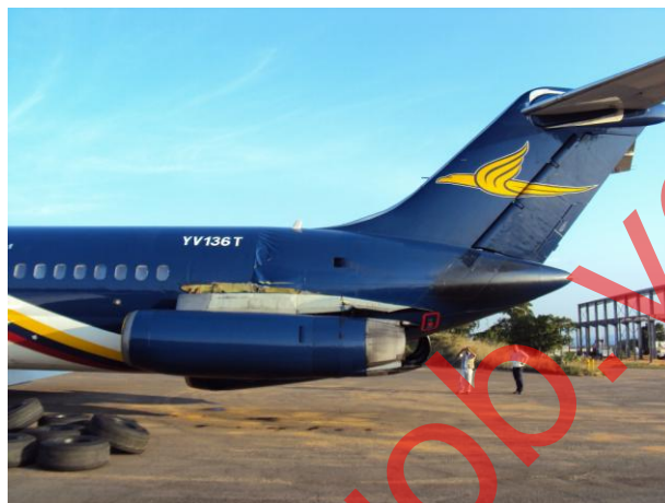
Fotografía 3 Lado izquierdo de la aeronave