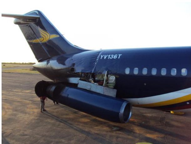
Fotografía 2 Lado derecho de la aeronave