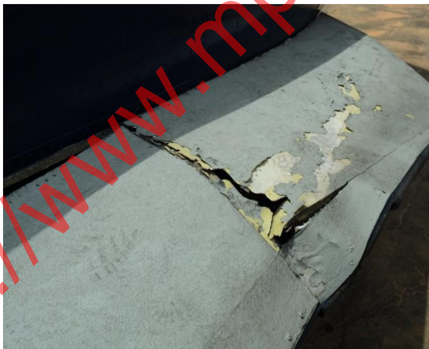
Fotografía 4 Fractura por desgarramiento pilón del motor 1.

Fracturas por desgarramiento en la sección posterior de la estructura de ambos pilones.