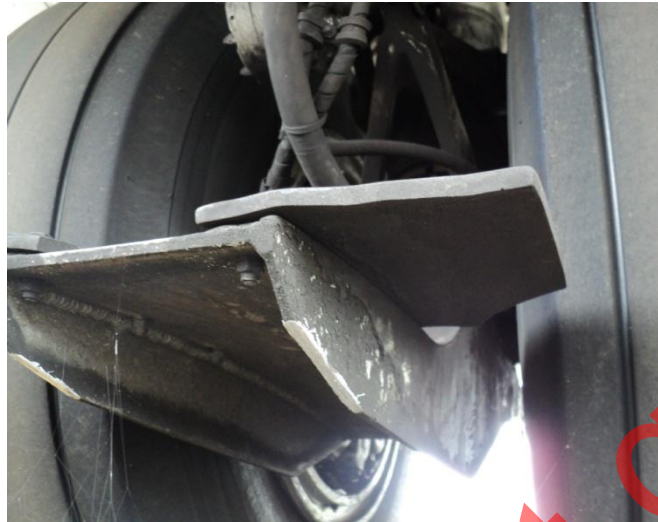
Fotografía 9 Desgaste en el deflector del tren principal izquierdo.